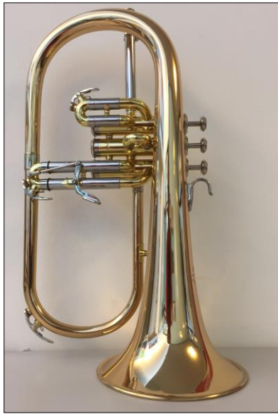
Flügelhorn mit Perinetventilen