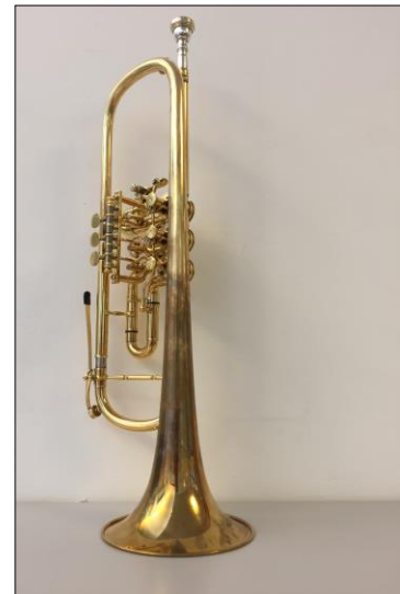
Trompete mit Drehventilen