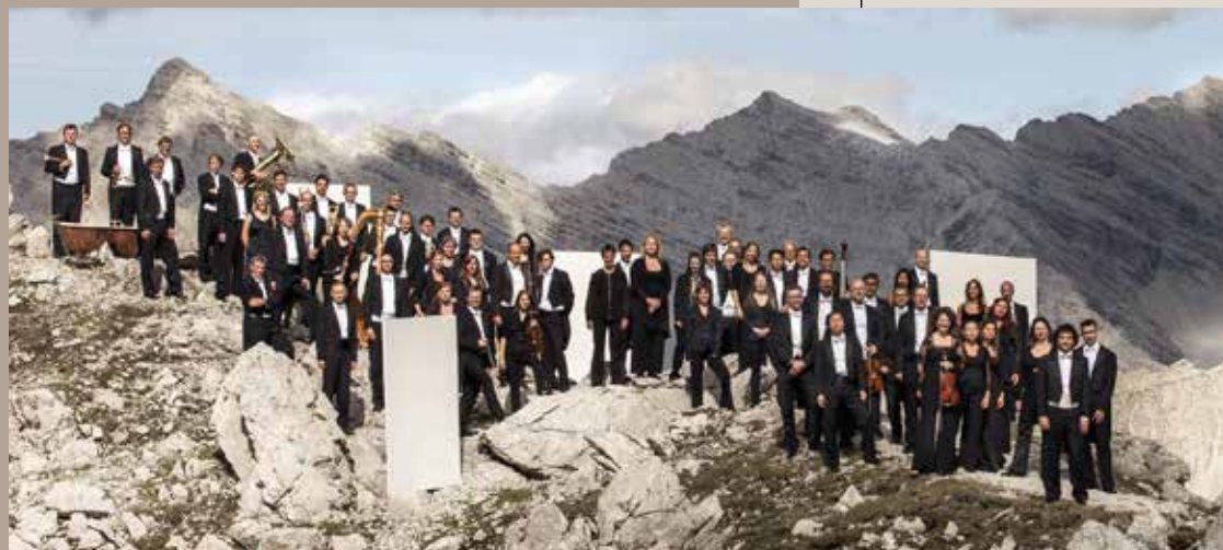
tiroler symphonieorchester innsbruck